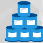
Hyvin säilyvää ruokaa