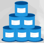
Hyvin säilyvää ruokaa